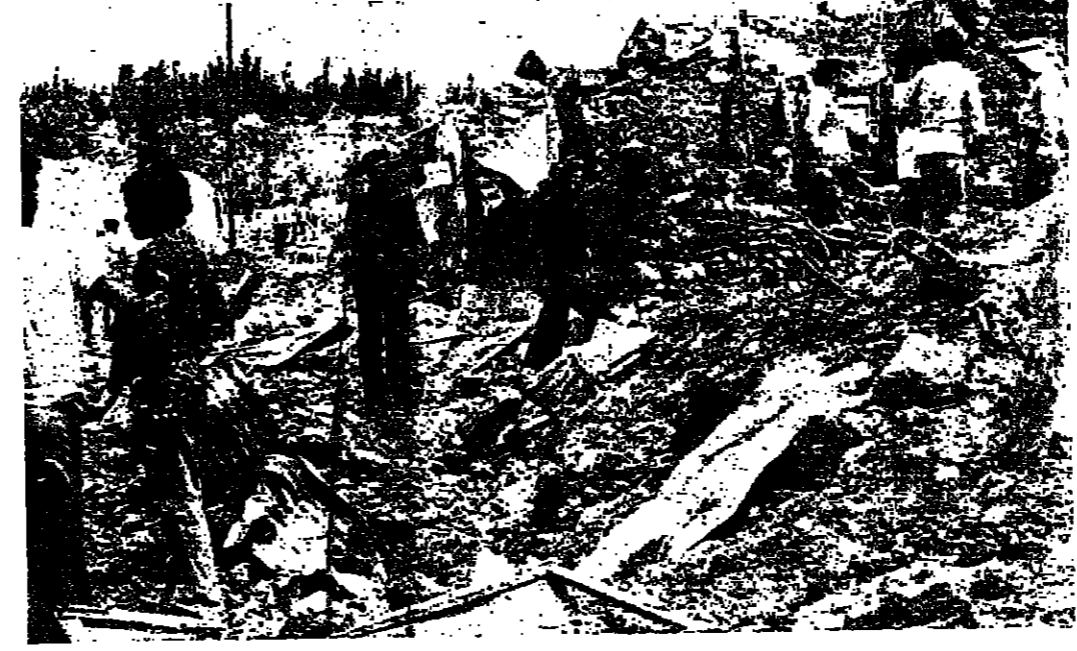
جولة بين انقاض المنازل المهجورة في مخيم البرغلة

عشرة دقيقة ٥٥ ، عندما كنت في ساحة اليبس ، في طريقي الى سيدار . وقد حلفت تحت طائرات حربية اسرائيلية ، بصورة مفاجئة ، وقامت بعمليات تصف بيروري لخفي البرغلية وبرج رحال ، اللذين يبعدان ٨ كيلو مترات عن صور . وكانت الطائرات المست تحذف من الشمس مظلة لها ، اثناء الاغارة من ارتفاعات شاهقة ، والتي ووجهت بمخاطبة عنيفة من اسلحة الجيش والقنطرة . وفي لحظات غطت سحب الدخان الاسود منطقة المخيم ، وانطلق صوت صفارات الانذار في صور وسيدا والنبطية ، فالتفت شوارعها . واستمرت الغارة حوالي ٢٥ دقيقة ، القت خلالها الطائرات المعادية اكثر من ١٢ صاروخا ، سقط معظمها وسط